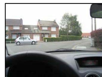
Véhicule en approche