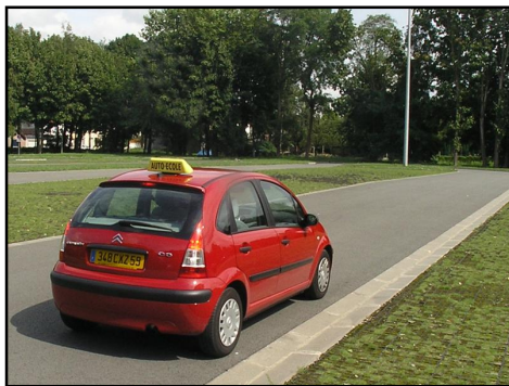
Évaluation avec un moniteur

L'élève sera évalué selon des critères bien déterminés. Les vérifications des compétences sur les savoirs faire et savoirs être du candidat sont indispensables avant de commencer la formation.