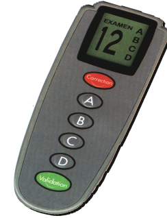
Boîtier réponses de l'examen