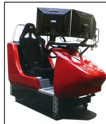
Simulateur de conduite

L'évaluation est obligatoire et devra se faire avant le début de la formation. Cette évaluation déterminera approximativement le nombre d'heures de conduite que le candidat devra effectuer avant de passer son permis. Un contrat de formation sera alors signé entre l'auto-école et l'élève.